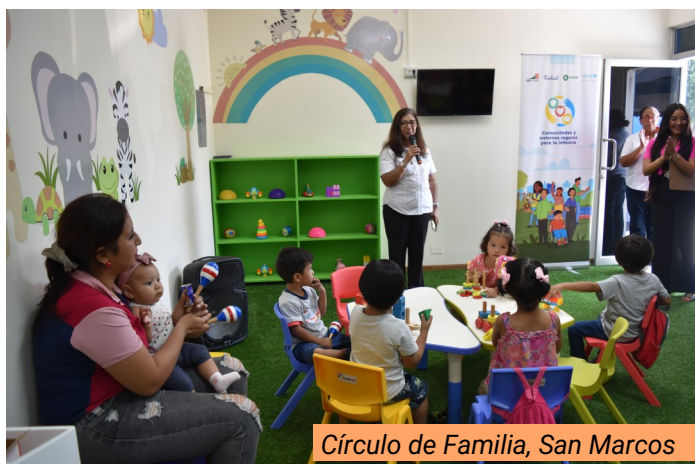
Círculo de Familia, San Marcos

Desde la Región Central-Occidental se han ejecutado proyectos desde la primera infancia hasta con personas adultas mayores, uno de ellos es “Contribuyendo a la prevención de la violencia contra la niñez y adolescencia y la violencia basada en género con enfoque comunitario” en cooperación solidaria y financiera de UNICEF.