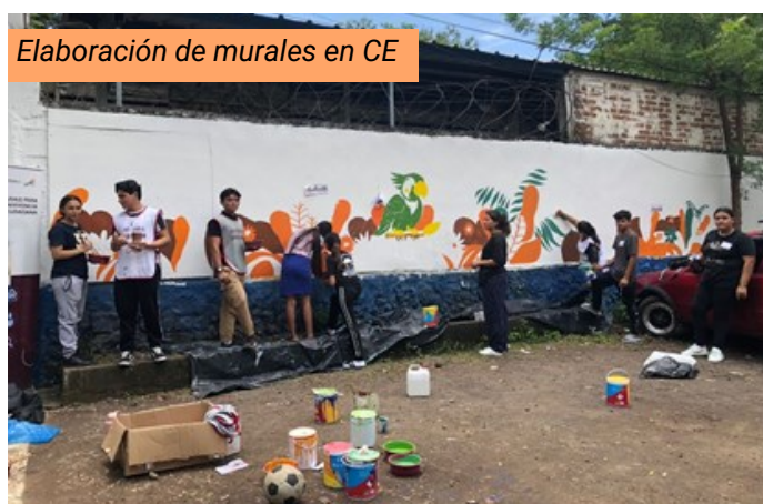
Elaboración de murales en CE

Además, acciones de integración y convivencia a adolescentes en intercambio para la convivencia en valores, (adolescentes, padres y madres) en jornadas de integración familiar, y adolescentes y jóvenes participando en rallies comunitarios (arte y deporte).