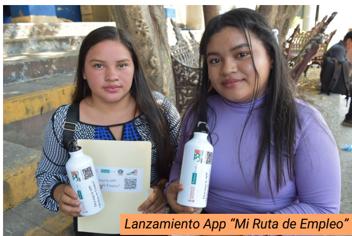
Lanzamiento App “Mi Ruta de Empleo”

Se beneficiaron directamente a 1,664 jóvenes escolarizados y 1600 jóvenes no escolarizados de 20 comunidades urbanas y rurales. Haciendo un total de 3,264 jóvenes.