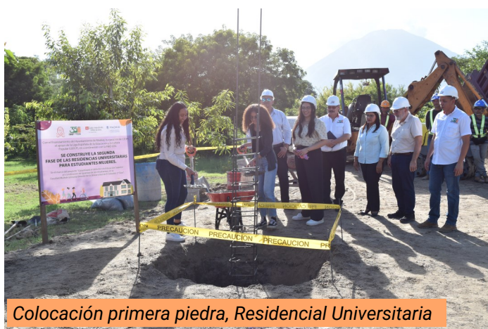
Colocación primera piedra, Residencial Universitaria

El proyecto para la Convivencia Ciudadana “Tejiendo Caminos, Sanando Futuros” , ejecutado en cooperación solidaria con Chemonics y el financiamiento de USAID, contribuyó al establecimiento de una cultura de paz promovida por adolescentes y jóvenes en riesgo social desde un enfoque restaurativo y