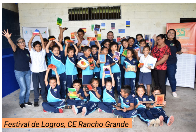
Festival de Logros, CE Rancho Grande

Con tres componentes: el primero, la participación integral de la juventud de manera inclusiva, convivencia ciudadana y establecimiento de una cultura de paz para la transformación social, mediante un programa de Juego Limpio (Deporte con Valores) y jornadas de dibujo y pintura; el segundo equipamiento con pupitres y con la construcción de un huerto escolar, los dos primeros componentes en el Centro Escolar Caserío Rancho Grande, y el tercero fue el equipamiento y reactivación del aula de informática del ITTEC para brindar cursos de informática y apoyar con la realización de tareas a estudiantes de los centros escolares aledaños a la zona de Tecoluca contribuyendo a la mejora de la calidad Educativa. Con este proyecto se tuvo una población beneficiaria directa de 150 personas.