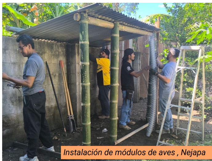
Instalación de módulos de aves , Nejapa

Para el año 2024, se benefició a un total de 75 personas adultas mayores.